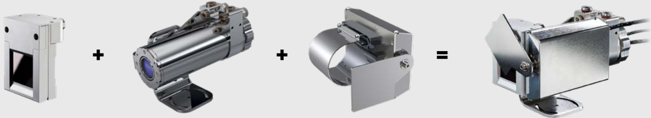
Air purge laminar (ACXIAPL | ACXI1MAPL | ACXIMTAPL)